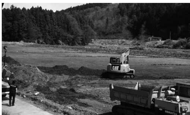
滝輪高原地内の農地復旧工事

町長 ①社川の堤防が決壊した場所では、作付けが間に合わない所も出る見込みだ。 ②補助、単独事業とも復旧を順次実施しているところだ。 ③早期の復旧を図って行く。