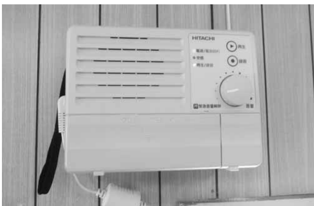
各家庭に配られた戸別受信機

② 放送が数多く混在すると本来の防災行政無線の趣旨から離れるので、一定程度限定した形で対応したい。