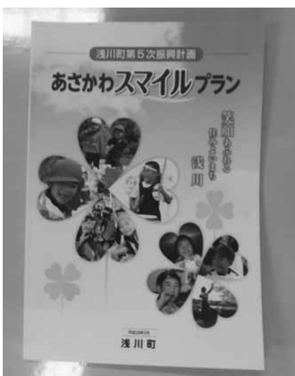
あさかわスマイルプラン

町長 単独事業の取り扱いについては、町の振興計画、行政区要望、私の公約等「全ては町民のために」を基本に据え、事業の必要性及び優先度と財源を考慮し対処していく。体育館、公民館も耐震構造になっていないので財源などを考慮し計画的に実施したい。