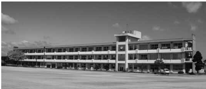
昭和53年完成の浅川中学校

問 第5次振興計画の実施計画から浅川の大規模改造事業を削除し、新規事業として、小学校中学校の一体化を含め計画するとして小・中学校校舎整備事業が示され、令和2年度予算に基本構想策定業務委託が計上された。次の点について伺う。 ①1カ所に一体化した校舎建築に取り組むものか。 ②小中一貫校の方向性はあるのか。 ③小中一カ所となれば、跡地の利用も校舎整備事業と並行して進めるべきと思うが。