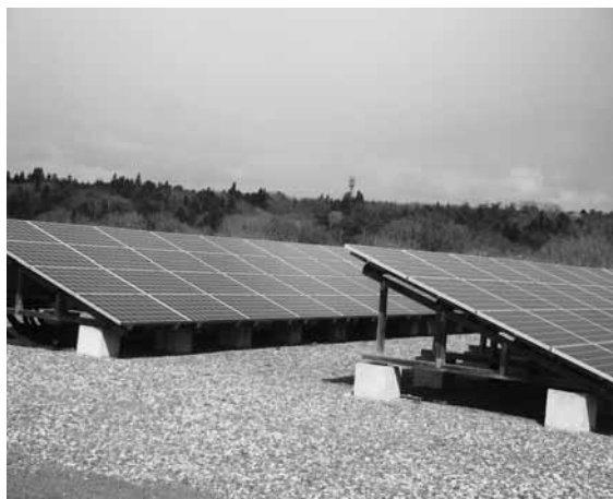
設置が増えている太陽光発電

問 平成28年から電力の完全自由化が行われ、それまで全国で10の電力会社が独占していた電力小売りが全面自由化され、多くの企業が政府の認可を受け、電力販売に参入している。電力自由化の目的は競争による電気料金の引き下げにあり、入札制にして電気代を節減する自治体は増えている。私が資料を入手した二本松市では今年度、学校など268施設で33件の入札を行い、以前より7500万円も電気代を節減した。財政規模からすると、わが町でも700万円くらいの節減が期待できる。