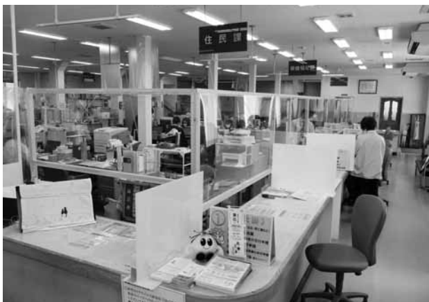
アクリル板が設置された役場窓口

町長 ①2月25日、28日に対策会議を実施し、予防対策の周知、今後の対応、小中学校・こども園の休校・休園取