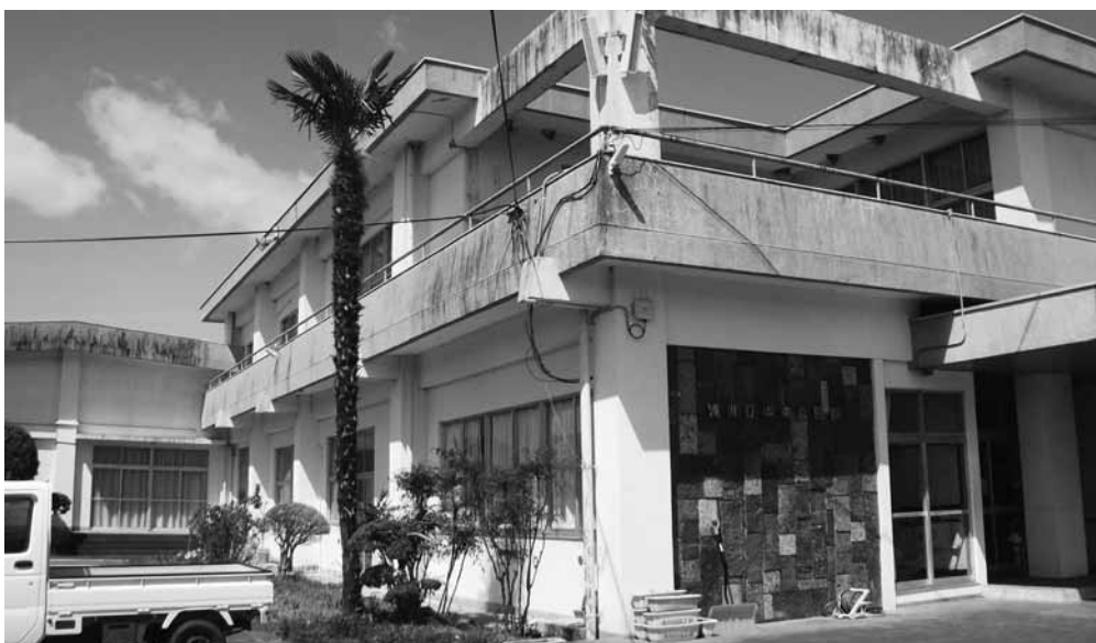
老朽化が目立つ中央公民館

答 委託料1300万円だが、公共施設の適切な管理を行うため町内公共施設、学校関係、公民館、役場庁舎、集会所等の現況調査を行い、今後の在り方の方角性を出す。民間の業者に委託する。国は令和2年度中には作成するよう求めている。