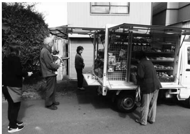
「来るのが楽しみ」 移動販売

問 町と農協、商工会の三者による事業として始めた農産物などの移動販売は、高齢者や障がい者などの買物弱者といわれる方々にとつての福祉事業的なもので、マルシェの売店と共に実施され喜ばれている。ところが、定められた日に待っていても来ない。電話しても通じないと苦情が寄せられている。当事者に聞くと「仕入れから運転まで今のままでは厳しい」との事。三者、町、農協、商工会がきちんと定期的に協議をして何が問題なのか解決して、待っている人々の声に応えるべきではないか。