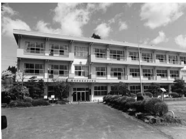
跡地利用が課題の小学校（旧里白石小学校）

2点目については跡地活用を優先に地域の活性化が図れるよう進めていくが、最終的には解体することも選択しなければならないと考えている。