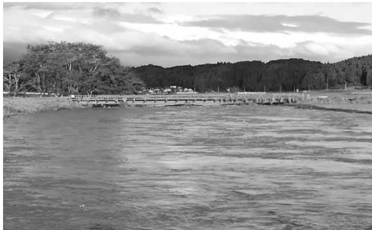
日渡橋上流の水郡線鉄橋

①現在、職員で組織する「防災対策チーム」により浸水状況を踏まえ、検証作業をしている。変更すべき避難場所を検討している。今後、防災会議で議論していただくことを予