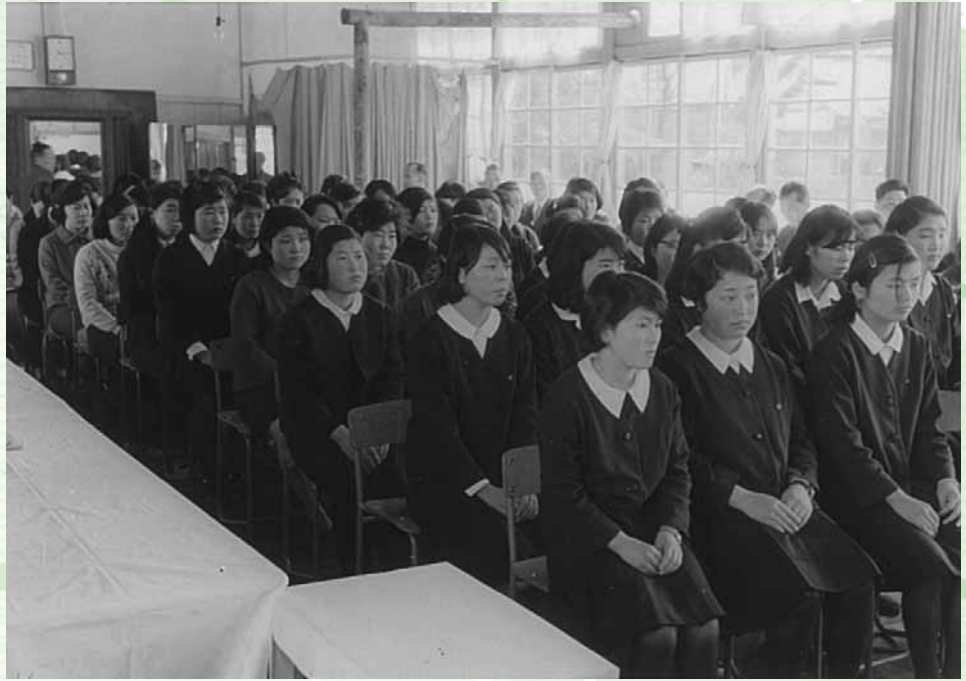
町立浅川産業高等学校入学式

昭和23年4月30日に県立石川女子高等学校定時制分校として発足し、昭和48年4月に県立東白川農商高等学校に編入され、閉校をむかえる。