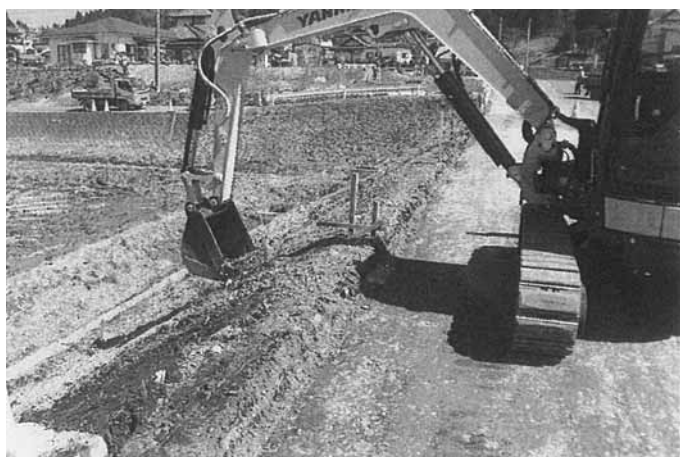
里白石 浅川橋付近の町道復旧工事

①防災計画の一部見直し、又ハザードマップの改正等必要な案件に、速やかに対応できる体制を図り、防災会議に向けて準備をしたい。