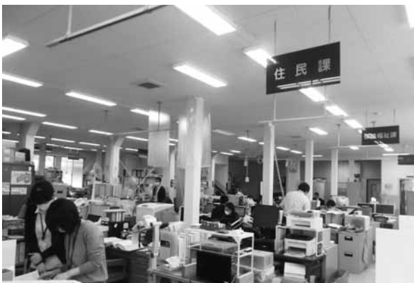
現在10部局の浅川町役場

総務課長 窓口の一本化、災害対応部署、業務量に応じた職員配置について機構再編検討事項として対応する。