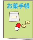
⑤ お薬手帳 （持っている方）