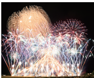
秋の豊秋刈上げ花火