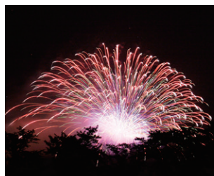
浅川の花火 名物 地雷火