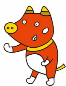
ふくしまを応援する「ペコ太郎」