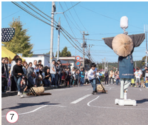
①文化祭会場となった町民体育館 ②アンパンマンと握手 ③色鮮やかな各団体の作品 ④空気清浄機大当たり!! ⑤即売・飲食コーナーが並ぶ会場 ⑥大勢の人が見に来たアンパンマンショー ⑦白熱!第10回米引き競争