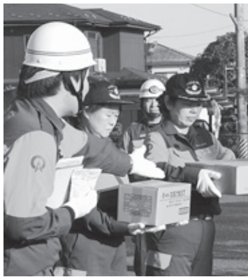
備蓄用品の取り扱いについての説明

消防団による中継放水訓練後は、地元住民を対象にした水消火器の取り扱い訓練があわせて行われました。訓練では実際に消火器を使用し、消火器による消火の仕方や有効範囲などを浅川分署員の方から教えていただきました。 また、カンパンやアルファ米、災害用備蓄パンなど、非常時の備蓄用品の取り扱い訓練も行われました。