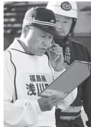
火災発見の通報訓練

今回の訓練は、石川消防署浅川分署の協力のもと行われました。当日は約215名が訓練に参加し、町中央公民館において火災が発生したことを想定し、地域住民による通報訓練、町消防団による中継放水訓練などが行われました。