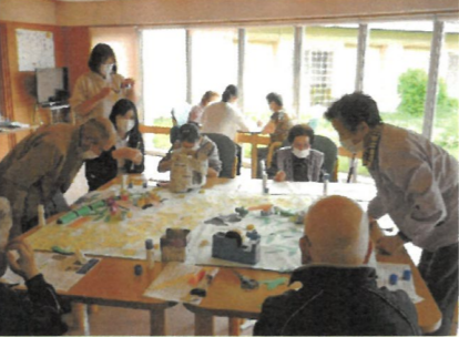
昨年、皆で仕上げた七夕飾り壁面制作をしている所です。