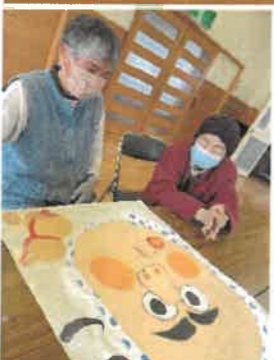
↑福笑い上手ですね!