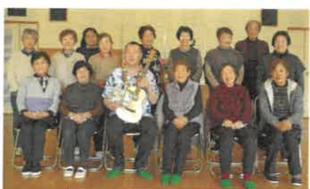
↑ウクレレ世界一を聴きました