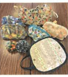
↑皆さんが夢中になったバックなど