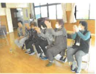
↑ゲームを楽しみました