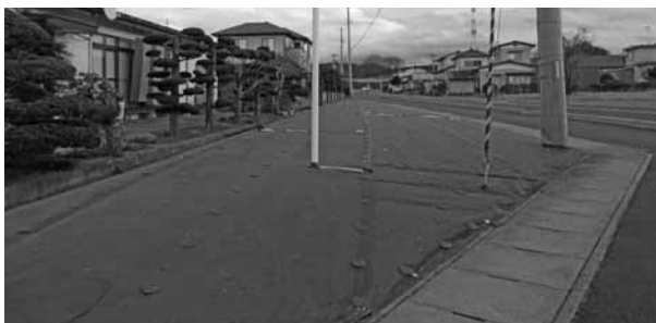
町内に設置された防草シート