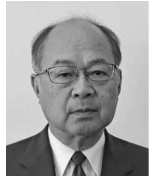
きだ はるき 木田治喜議員

問 平成29年に施行された「義務教育の段階における普通教育に相当する教育の機会を確保に関する法律」に基づき児童生徒の不登校に対して支援が行われてきたが、全国的に不登校児童生徒が増加の一途をたどっている。そこで当町の実態把握と改善への考え方を伺う。