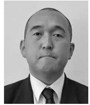
かんのともおき 菅野朝興議員

町長 ①町道の雑草対策として部分的に防草シートを施工している箇所がある。防草シートを敷くことにより、製品にもよるが、数年から10年程度は、除草の手間が省けるものと考えている。 ②近年、特に自走式やラジコン式など、様々な用途に応じた機械が販売されており、情報収集に努めている。これらの情報をもとに、道路維持作業員と意見交換も行っている。引き続き作業効率の向上や負担軽減になるよう