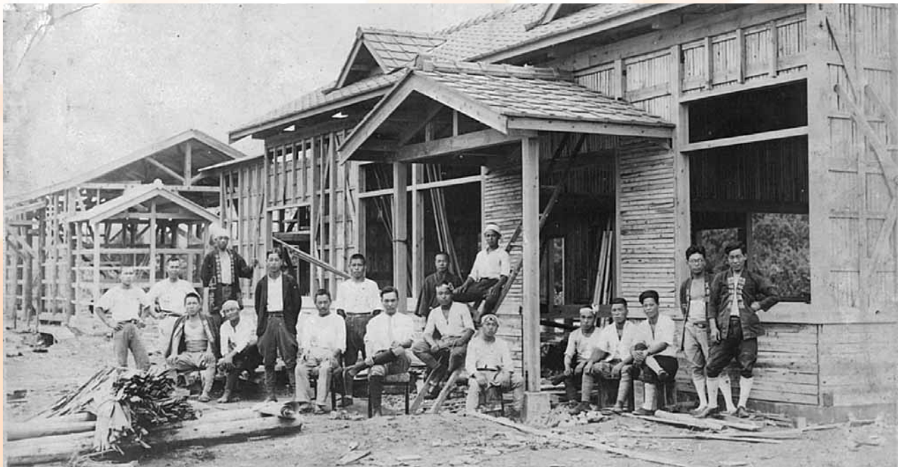
約 90 年前の浅川駅舎建築風景／背戸谷地 根本宏さん提供

古里の写真をお持ちの方は、ぜひご連絡下さい。誌上でご紹介させていただきます。 浅川町議会事務局 36-1182