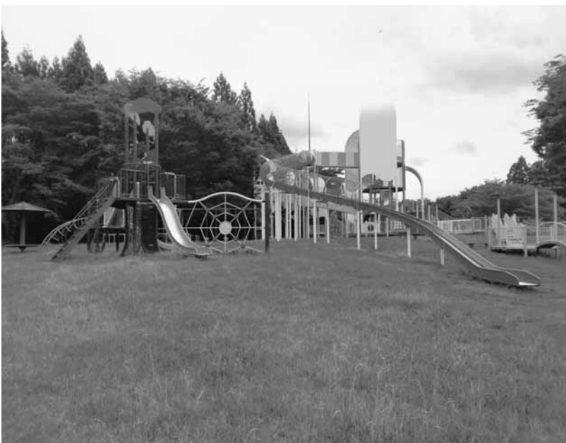
大型遊具のある公園