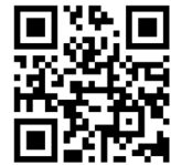
つうえんポータル

右記の2次元コードを読み込み、つうえんポータルにアクセスし、その画面にてお住まいの自治体を選択し、利用申請をしてください。