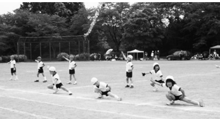
こっちも決まった!