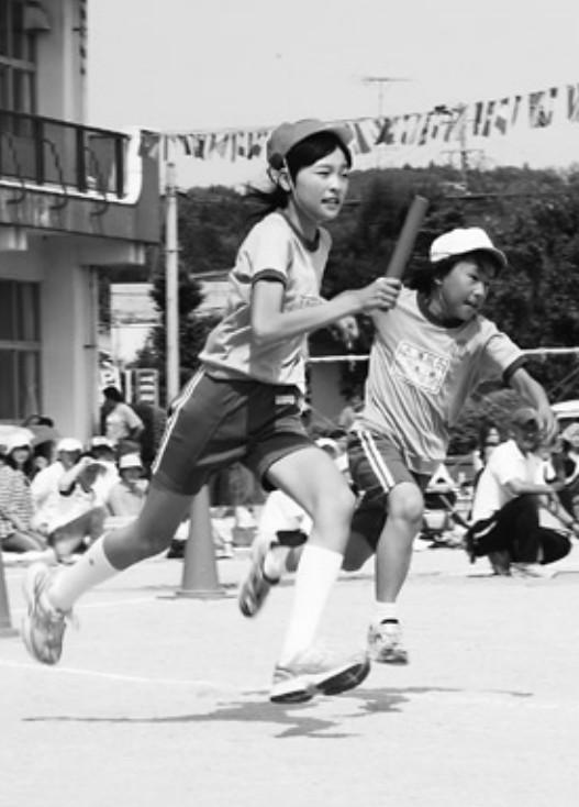
急もつかせぬ激しい戦い