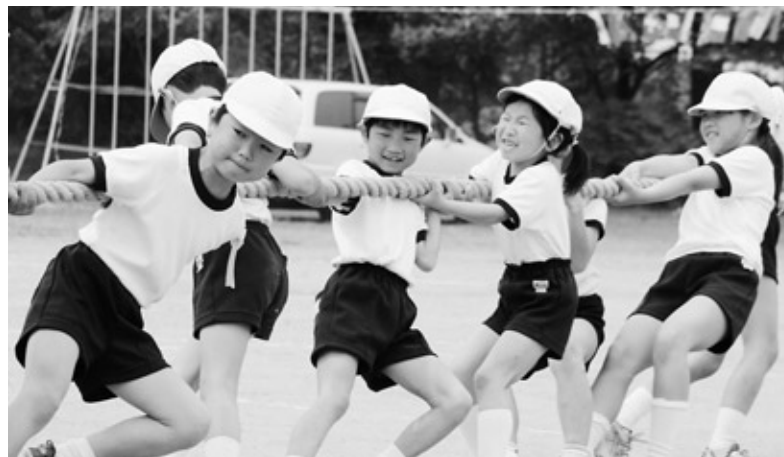
力いっぱい引っ張れ