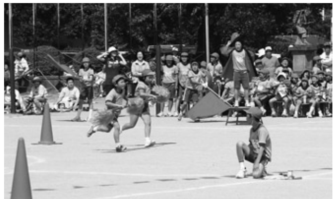
応援を受け全力でダッシュ