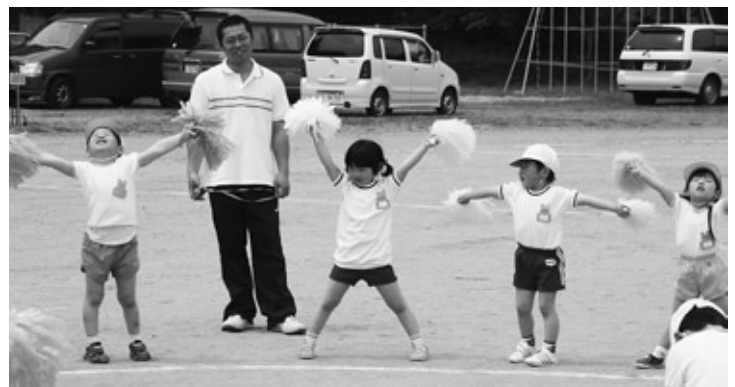
保育所の子どもも決めます