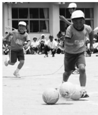
ドリブルは難しい