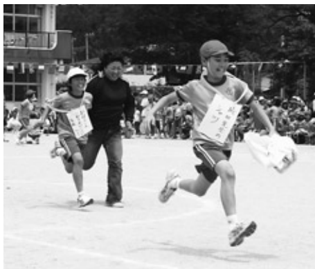
探し物は何ですか?