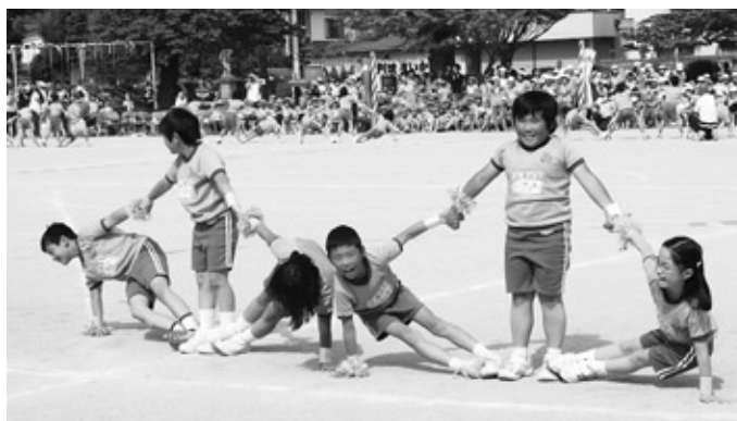
こっちも決まった!