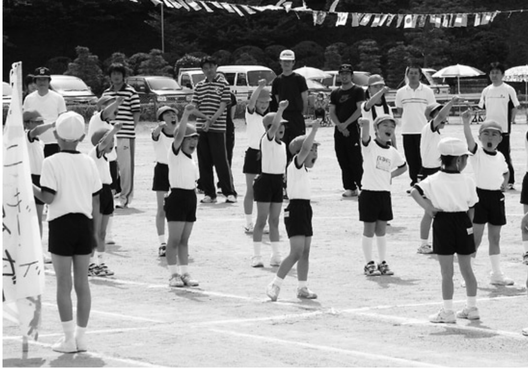
がんばるぞー! おー!