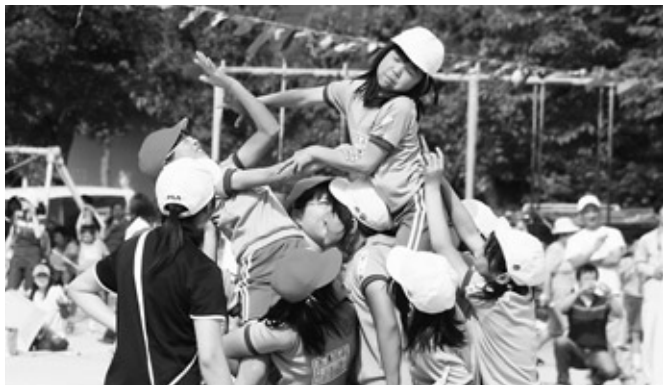
激しい乙女の戦い