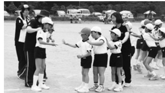
ジャンカでジャンケン