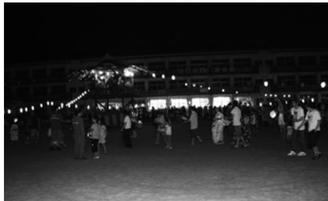
8/14・15 両町青年会主催の盆踊り大会