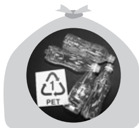
ペットボトルはペットボトルで まとめましょう