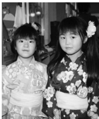
7/31 幼稚園なつまつり