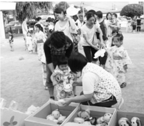
7/23 浅川保育所夕涼み会