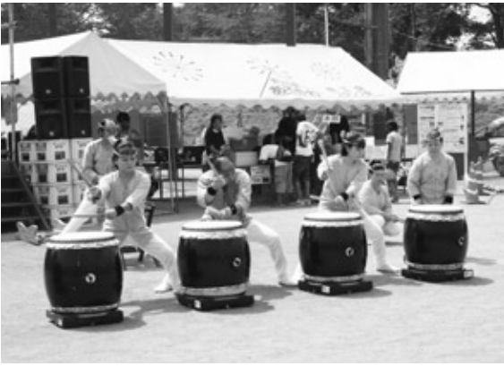
地雷火太鼓の演奏