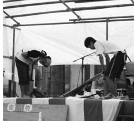
バルーンファイト