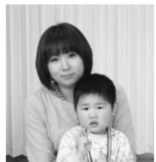
なまため だん くん