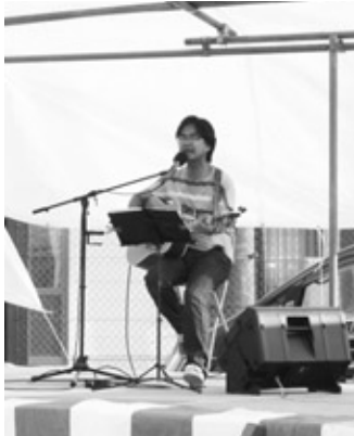
菊池章夫コンサート