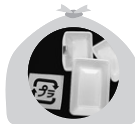
白色トレイは白色トレイで まとめましょう