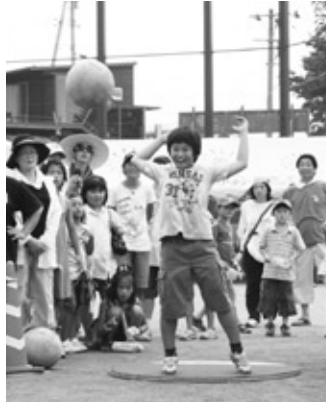
尺玉投げ全国大会