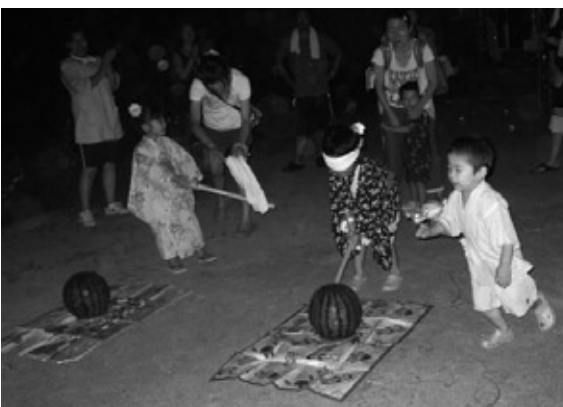
8/7 山白石保育所夕涼み会