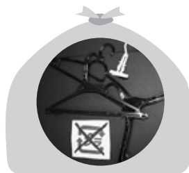
木製・樹脂製ハンガーは 可燃ごみです