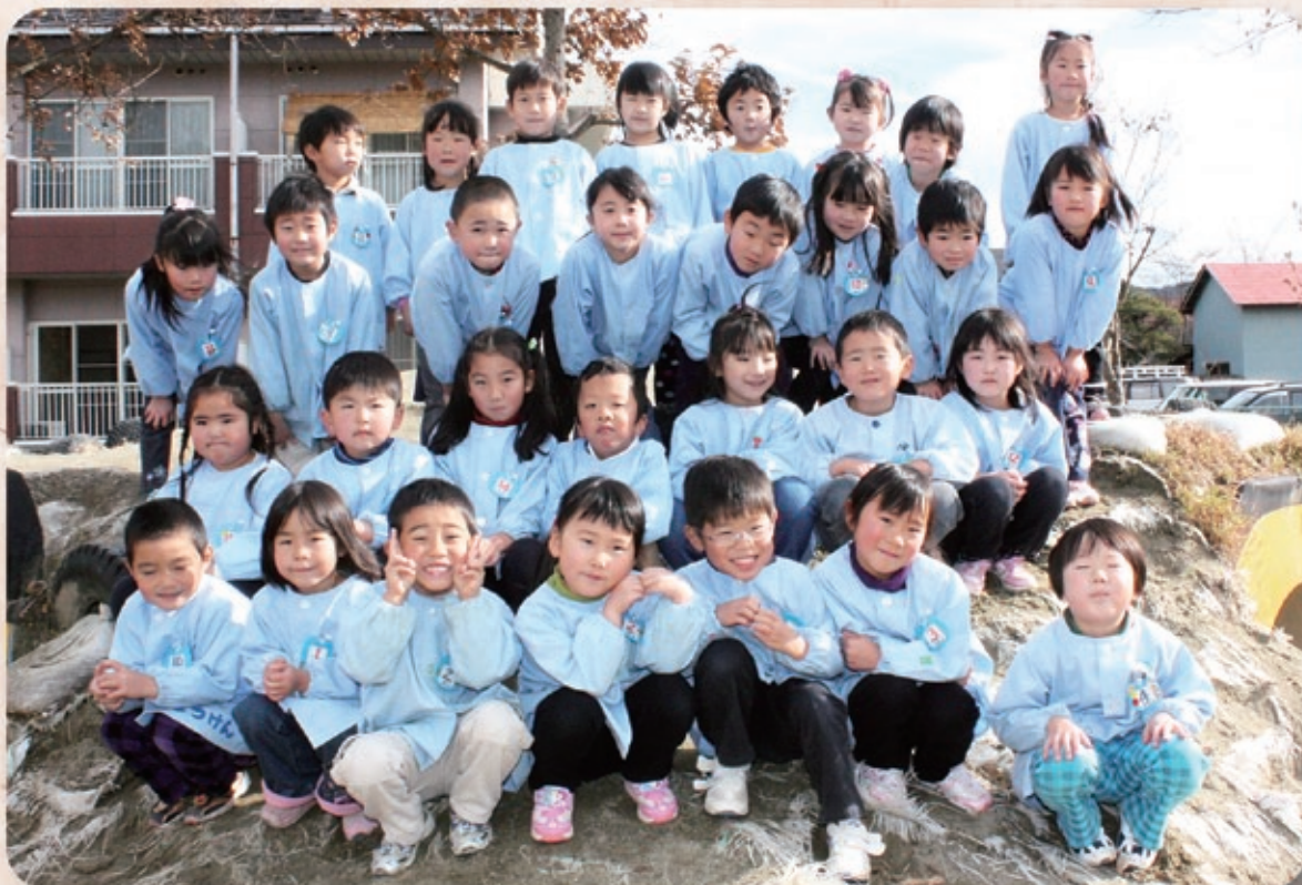
浅川幼稚園ぽぷら組のみなさん