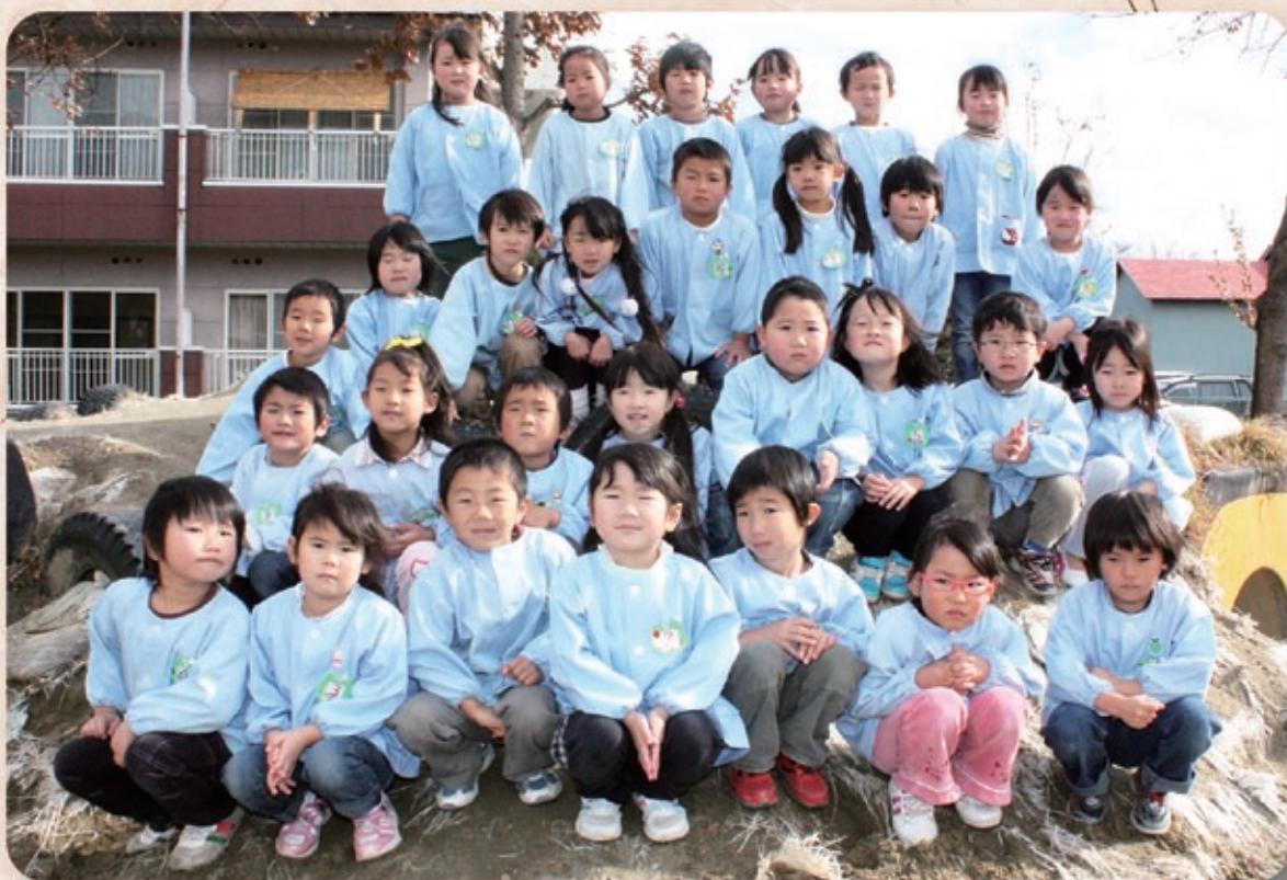
浅川幼稚園いちよう組のみなさん