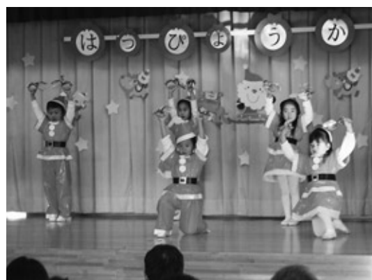
練習の成果を披露

町防犯協会による年末年始 交通事故防止街頭活動が12月 10日、磐城浅川駅前を中心 に行われました。 防犯協会役員約60名が参加 した活動では、3つの班に分 かれ町内を巡回し、チラシな どを配布しながら交通事故の 防止や犯罪被害に注意するよ う呼びかけを行いました。