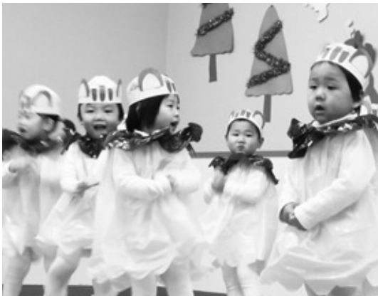
クリスマス会が12月16日、浅川保育所で行われました。