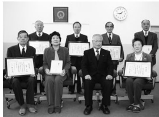
長年の功労に感謝

両町区主催による年末年始における防犯防火・事件事故防止街頭活動が12月17日、町内一円にて行われ、両町区の役員や警察関係者、消防団など約20名が参加しました。 参加した皆さんは、パトカーやポンプ車とともに巡回し、チラシなどを配りながら注意を呼びかけました。