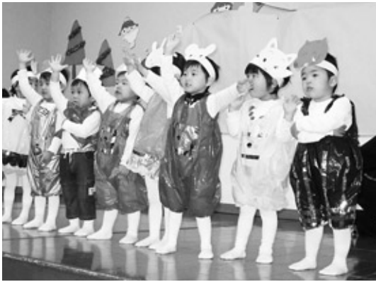
サンタがやって来た