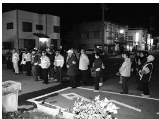
交通事故・犯罪に注意

町防犯協会による年末年始 交通事故防止街頭活動が12月 10日、磐城浅川駅前を中心 に行われました。 防犯協会役員約60名が参加 した活動では、3つの班に分 かれ町内を巡回し、チラシな どを配布しながら交通事故の 防止や犯罪被害に注意するよ う呼びかけを行いました。