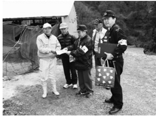
高齢者の交通事故防止

町高齢者交通安全指導隊による高齢者宅交通安全啓発訪問が12月15日、町内一円で行われました。 町内にいる要指導高齢者宅を訪問した隊員は、交通事故防止のチラシや反射材などを配布し、交通事故に遭わないよう注意を呼びかけました。