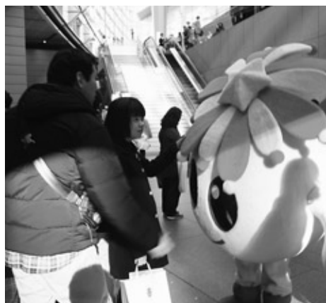
あさまるも浅川町のPRを頑張ってくれました

イベントには町のイメージキャラクター「あさまる」も参加し、精一杯浅川町の魅力をPRしてくれました。在京浅川会の皆さんや「あさまる」の協力もあり、ブースには大勢の人が訪れ、沢山の人が「花火の里あさかわ」の魅力を伝えることができました。在京浅川会の皆さん、訪れてくださった皆さん、大変ありがとうございました。