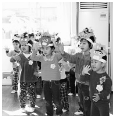
「鬼さんバイバイ、もう来ないでね」

豆をまくのには、穀物や果物は邪気を祓うと考えられていることや、昔、鞍馬山に現れたという鬼を豆で退治したこと、「豆と魔滅(まめ)」を掛けたことなどの理由があります。