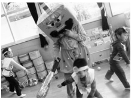
保育所に入ってきた鬼をやっつけろ！