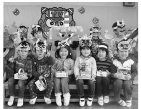
鬼と一緒に記念写真