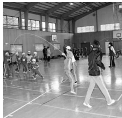
里白石小学校の団体跳び