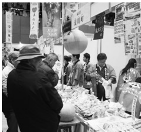
応援に駆けつけてくださった在京浅川会の皆さん