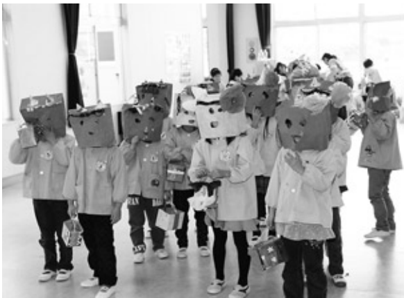
幼稚園ではいろいろな鬼がいました

節分の豆まき会が、2月3日(月)、浅川幼稚園、各保育所において行われました。 豆まき会では、先生から節分や豆まきのお話を聞いたあと、子供たちがそれぞれこわい鬼の面や角をかぶり、自分たちの中にある「泣き虫鬼」や「怒りん坊鬼」、「意地悪鬼」を先生に退治してもらい、まかれた豆を子供たちが一齐に拾いました。中には豆を拾えず泣いてしまう子もいましたが、鬼には「お譲り鬼」さんもいたようで、優しいお友達と先生から分けてもらっていました。 また、浅川保育所と山白石保育所では、豆まき会の途中で教室に入ってきた鬼を子供たち自らが退治して自分たちの中にある悪い鬼と保育所にやってきた鬼の両方を退治し、元気な豆まき会が終了しました。