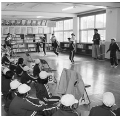
体育館が改修工事中の山白石小学校では図書室で行われました

児童たちは、この日の団体跳びのために早朝や休み時間に練習を重ねており、チームの心をひとつにし競技に臨みました。その結果、浅川小学校の6年2組が息の合ったチームプレーで校内記録を更新するなど、練習の成果を十分に発揮することができました。また、当日は保護者の方も大勢応援に駆けつけ、児童たちは応援を背に受け、元気いっぱい記録更新に挑戦していました。