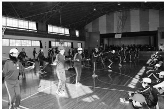
浅川小学校の技術跳び

記録会では、全員が挑戦する持久跳びや個人の技術を競う技術跳び、チーム対抗の団体跳びが行われ、技術跳びでは、あや跳びや交差跳び、二重跳びなどでそれぞれ記録にチャレンジしました。中にははやぶさ跳びや三重跳び、いなずま跳び(二重跳びを2回、はやぶさ跳びを2回、むささび跳び(別名交差二重跳び)を2回)などの高度な技に挑戦する児童もいました。