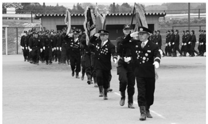
消防団全団員による分列行進