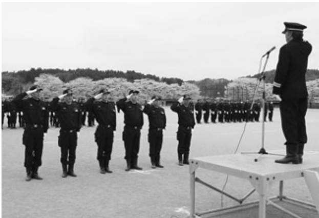
無火災分団を受賞する全分団長