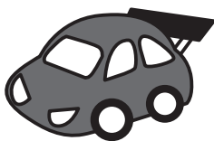
ストップ・ザ・不正改造