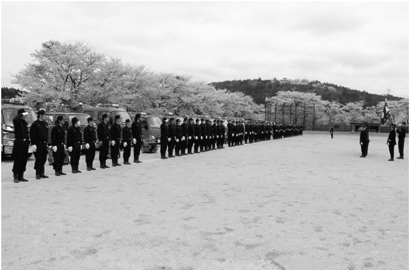
機械器具点検の様子