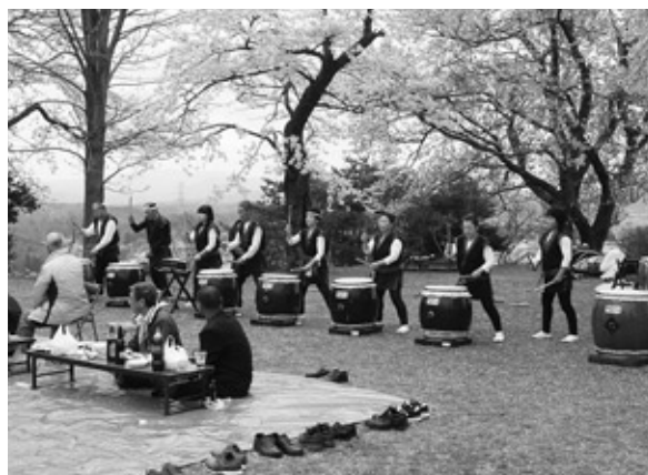
地雷火太鼓の皆さんが歓迎の太鼓を披露

また、アトラクションとして「地雷火太鼓」の皆さんによる演奏や、町女性団体連絡協議会の皆さんにもお手伝いいただき、温かい「すいとん」がふるまわれるなど、曇り空の天候でも体の芯から温まるものもあり、参加された皆さんにも大変喜ばれていました。