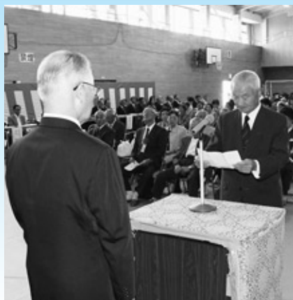
水野会長による謝辞