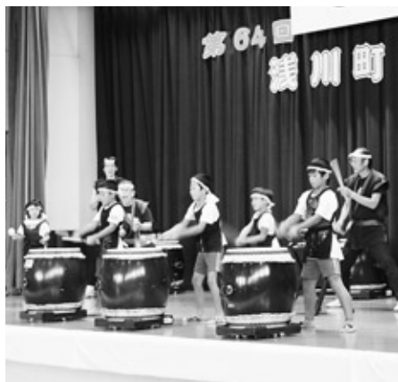
迫力ある浅川地雷火太鼓の演技