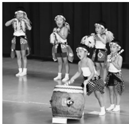
太鼓を披露する山白石保育所児童