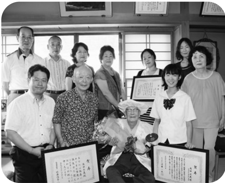
集まった親族と記念撮影。いつまでもお元気で。