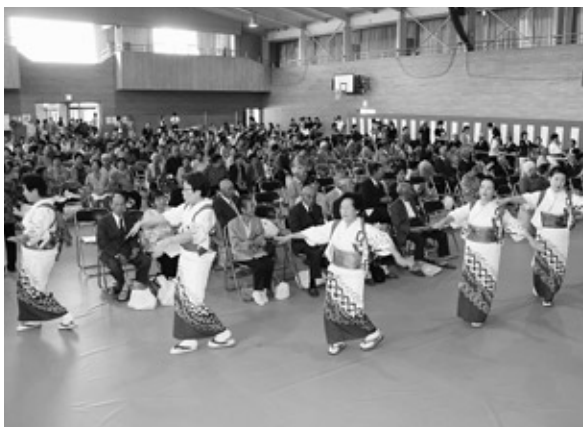
有志一同による「浅川音頭」