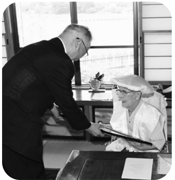
町長やご家族からたくさんのお祝いの品が贈られました