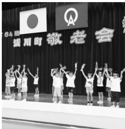
浅川保育所「しゃかりき!ソーランサンバ」

各保育所や幼稚園、婦人会や町内で活躍している芸能団体の方々などによる、歌や踊り、楽器の演奏などが行われ、出席された皆さんは楽しいひと時を過ごされました。