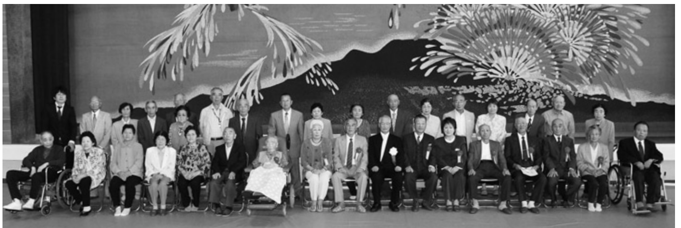
出席した受賞者全員での記念撮影