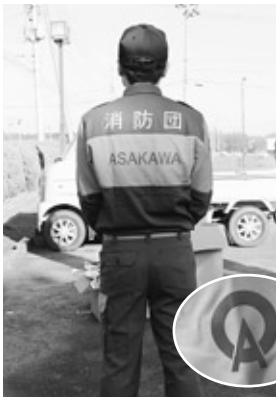
「ASAOKAWA」の文字と町章が入っています

消防団活動服の基準が変更されたことに伴い、町消防団の活動服が新しくなりました。新しい活動服は、この日の模擬火災訓練より使用されました。