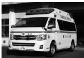
浅川分署に配備されている高規格救急車

救急車は、いつどこで発生するかわからない重篤(じゅうとく) (非常に重く生命に危険が及ぶ症状) な傷病者の搬送に備えているものです。タクシーや自家用車で医療機関に行けるときは、救急車の利用を控えてください。