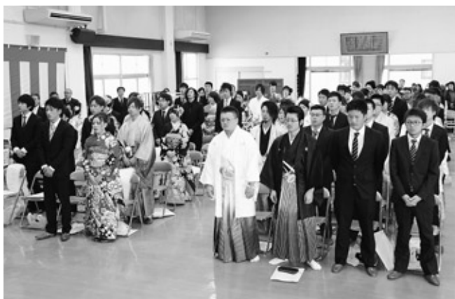
中央公民館で行われた成人式

平成27年浅川町成人式が、1月11日(日)に町中央公民館において行われ、平成6年4月2日から平成7年4月1日までに生まれた69名が、新成人としての第一歩を踏み出しました。