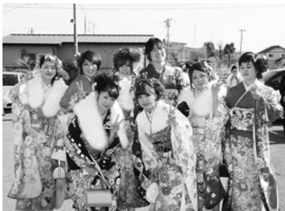
色鮮やかな振袖で会場も華やかに