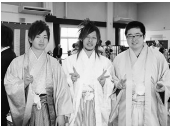
友達との再会で皆笑顔に

当日、新成人の皆さんは色鮮やかな振袖やスーツ、羽織袴姿に身を包み、友人達と記念写真を撮りあつたり、思い出話に花を咲かせたりして、旧友との久しぶりの再会を楽しみました。