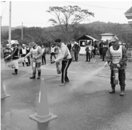
水消火器による消火器の取り扱い訓練

消防団による中継放水訓練後は、地元住民を対象にした水消火器、粉末消火器の取り扱い訓練が合わせて行われました。訓練では実際に消火器を使用し、消火器による消火の方法や有効範囲などを浅川分署の方に指導していただきました。