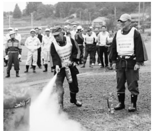
粉末消火器による消火訓練

取り扱い訓練に参加した方々は、いざという時に迅速に行動できるよう、真剣な表情で訓練に取り組んでいました。