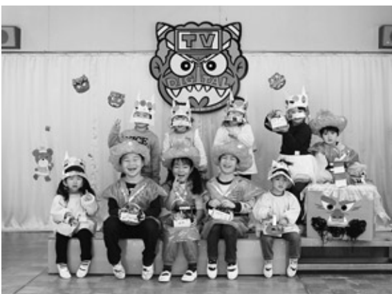
鬼のお面をかぶり記念撮影

節分の豆まき会が、2月3日(水)に浅川幼稚園、各保育所においてそれぞれ行われました。 豆まき会では、先生から節分にまつわる紙芝居やお話を聞いた後、子どもたちが自分で作った角やこわい鬼の面をかぶり、自分たちの中にある「泣き虫鬼」や「怒りん坊鬼」、「意地悪鬼」を先生に退治してもらいました。その後、まかれた豆を子供たちが一斉に拾いました。中には豆を少ししか拾えない子どももいましたが、優しいお友達と先生から分けてもらっていました。