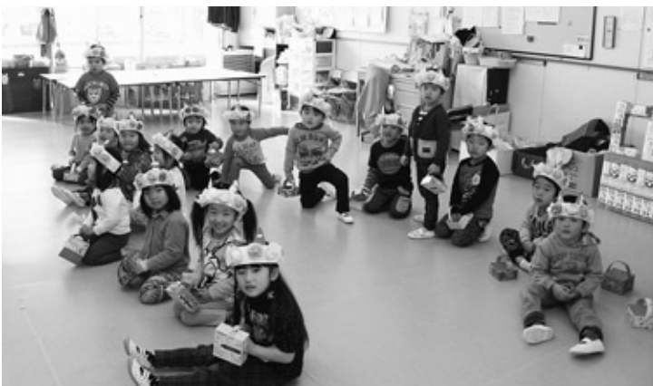
自分の中にある鬼を退治してもらうため、角をかぶる子どもたち

節分の豆まき会が、2月3日(水)に浅川幼稚園、各保育所においてそれぞれ行われました。 豆まき会では、先生から節分にまつわる紙芝居やお話を聞いた後、子どもたちが自分で作った角やこわい鬼の面をかぶり、自分たちの中にある「泣き虫鬼」や「怒りん坊鬼」、「意地悪鬼」を先生に退治してもらいました。その後、まかれた豆を子供たちが一斉に拾いました。中には豆を少ししか拾えない子どももいましたが、優しいお友達と先生から分けてもらっていました。