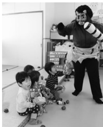
怖い鬼に泣きじゃくる子ども

また、浅川保育所と山白石保育所では、教室に怖い鬼が入ってきてしまいました。子供たち自らが退治し、自分たちの中にある悪い鬼と保育所にやってきた鬼の両方を退治しました。浅川幼稚園では、子どもたちが各教室を回り、「鬼はそと、福はうち」と元気な声で豆をまき、施設の中にいた邪気を払いました。