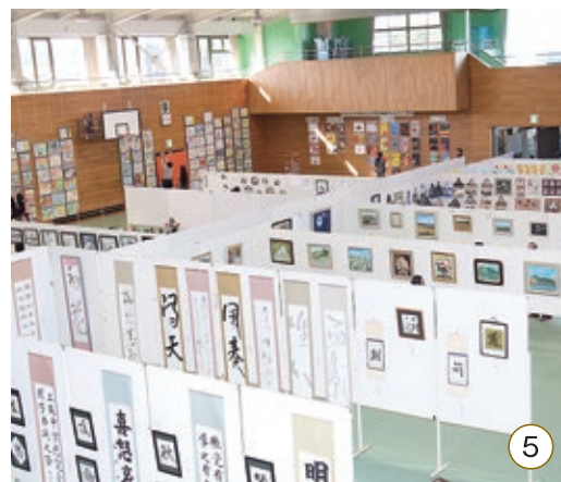
①紅白もちまき ②白熱！第9回米俵引き競争 ③即売・飲食コーナーが並び会場 ④大勢の人が見に来たアンパンマンショー ⑤文化祭の会場となった町民体育館 ⑥色鮮やかな各団体の作品