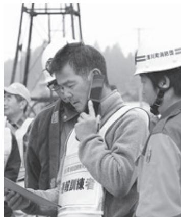
火災発見の通報訓練

今回の訓練は、石川消防署浅川分署の協力のもと行われました。当日は約175名が訓練に参加し、小貫生活改善センターにおいて火災が発生したことを想定し、地域住民による通報訓練、町消防団による中継放水訓練が行われました。