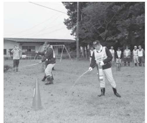
水消火器による消火器の取り扱い訓練

訓練に参加した方々はいざという時に迅速に行動できるよう、真剣な表情で訓練に取り組んでいました。