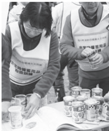
非常時備蓄用品の取り扱い訓練

消防団による中継放水訓練後は、地元住民を対象にした水消火器の取り扱い訓練があわせて行われました。訓練では実際に消火器を使用し、消火器による消火のやり方や有効範囲などを浅川分署員の方から教えていただきました。また、カンパンや災害備蓄用品など非常時の備蓄用品の取り扱い訓練も行われました。