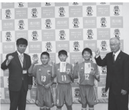
第41回全日本少年サッカー福島県大会(11月12日) 第10回JA全農杯チビリンピック8人制サッカー大会福島県予選会(12月2日～3日) 浅川SSSチーム