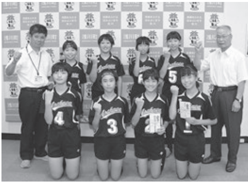
第70回福島県総合体育大会スポーツ少年団体育大会バレーボール競技の部 (8月19日～20日) 浅川スポーツ少年団バレーボールクラブ