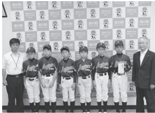
第22回高野山旗全国学童軟式野球大会 (7月28日～8月1日) あさかわファイヤーズ