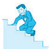
胸が圧迫される ように痛む