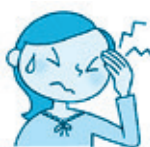
突然の激しい 頭痛