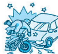
交通事故による 強度の衝撃