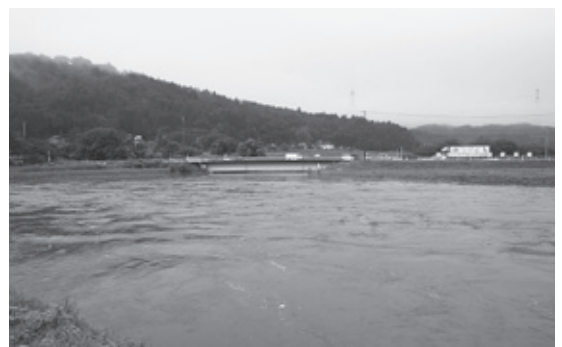
大雨により増水し、水位が上がっている社川

普段は水深が浅く流れが緩やかな川でも、台風や局地的集中豪雨などで大雨が降ると急に増水しとても危険です。また、万が一川が氾濫すれば、周囲が浸水し、道路や橋が通れなくなります。大雨が降って川の増水が予想されるときは、絶対に川へは近づかず、早めに避難するようにしましょう。