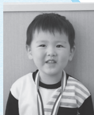
よした まほろ くん