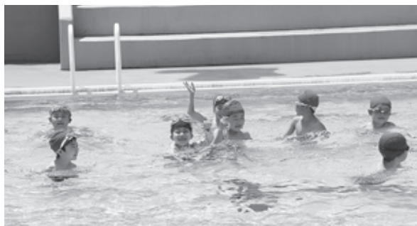
プールで元気よく遊ぶ子供たち