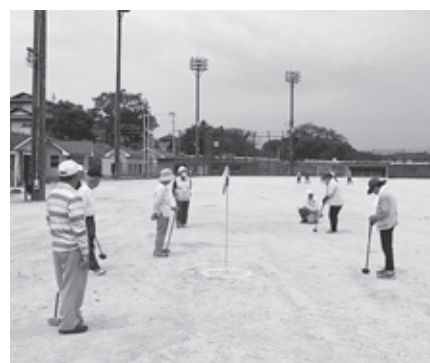
再開した公共施設を使用する団体