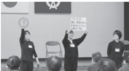
↑ポラリス保健看護学院の学生のみなさん

これから寒さも厳しくなるので、学生さんに教わったポイントを実践し、冬を元気に乗り越けるといいですね!