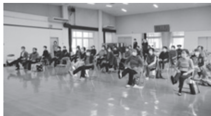
↑座ったままできる運動も教わりました!