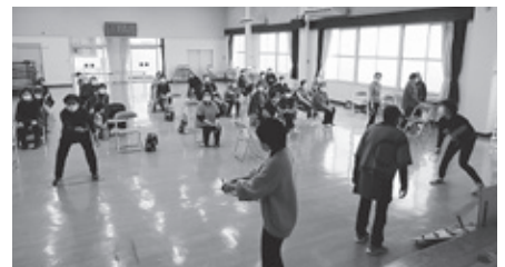
↑クロリティ体験の様子です。