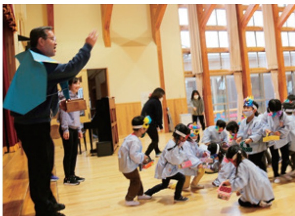
いっぱい豆拾うぞ!!

保育部では、園長先生に豆をまいてもらった後、教室に怖い鬼が入ってきました。園児たちは泣きながらも勇気を出して豆をぶつけ、悪い鬼を退治しました。