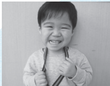
こむろ きょうやくん