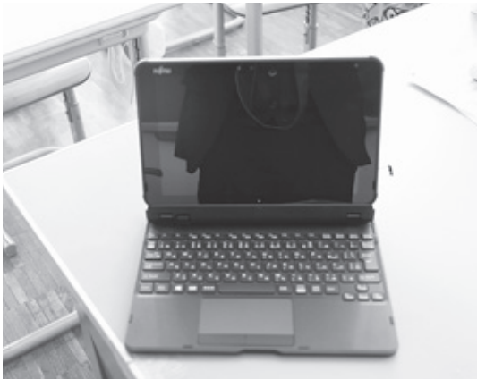
1人1台ずつ配備されたタブレット端末

これは、国が進めるギガスクール構想に基づき、整備したもので、今後、さまざまな場面で子どもたちの学びに活用されていきます。