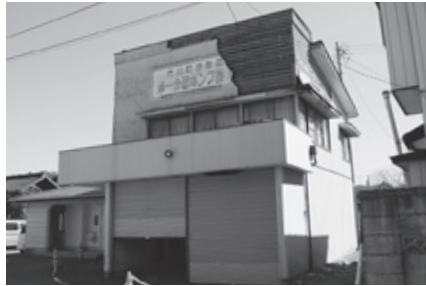
公共施設の被害状況