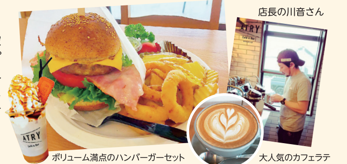
ボリューム満点のハンバーガーセット

浅川町の田園風景に囲まれた小さな隠れ家カフェ。世界各地から厳選された豆をエスプレッソマシンやハンドドリッパーで丁寧に淹れたコーヒー、ATRYオリジナルのパンを使ったハンバーガーやサンドウィッチ、手作りスイーツも人気です！ (※詳細は4ページに掲載しています。)