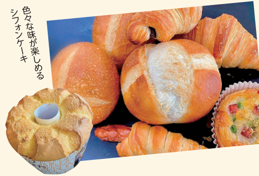
色々な味が楽しめる シフォンケーキ

あぶくま高原の地下水と、乳酸菌、納豆菌、酵母等の飼料を与え健康的に育てた鶏からとれたコクのある卵を生産しています。