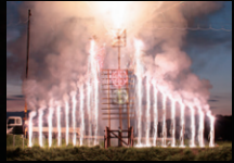
夏 浅川の慰霊花火