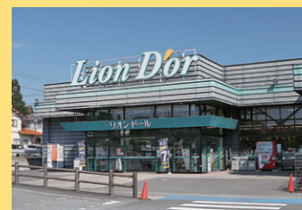
リオン・ドール浅川店