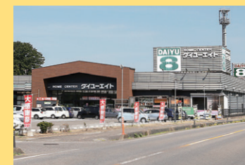
ダイユーエイト浅川店