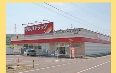
ツルハドラッグ浅川店