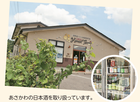
あさかわの日本酒を取り扱っています。