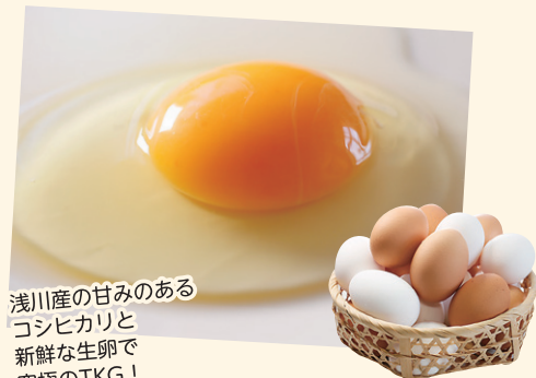
浅川産の甘みのある コシヒカリと 新鮮な生卵で 究極のTKG！