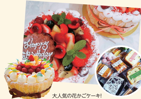
大人気の花かごケーキ！